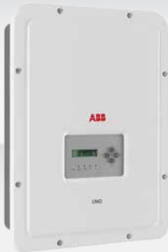
ABB String-Wechselrichter UNO-DM-1.2/2.0/3.0-TL-PLUS 1,2 bis 3,0 kW

— UNO-DM-TL-PLUS Outdoor String- Wechselrichter