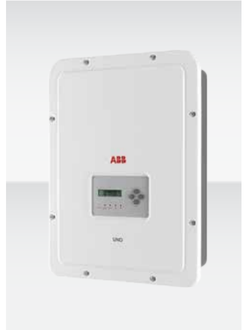
ABB String-Wechselrichter UNO-DM-1.2/2.0/3.0-TL-PLUS 1,2 bis 3,0 kW